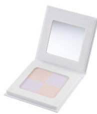
IROIKU プロテクトパウダー