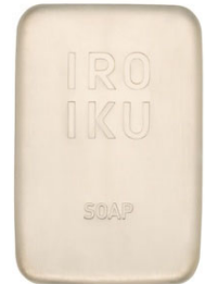
IROIKU フェイシャル ソープ 60g 550円 (税込)

「IROIKU スキンチューンナップ セラム」と同様に、精油のプロによる監修のもと、ラベンダー、イランイラン、マンダリン、パルマローザなど全部で9種の精油を厳選配合しており、リフレッシュできる優しい香りに好評をいただいています。