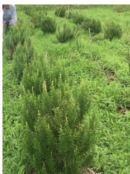
提携農園のローズマリー

今後は、「COSMOS 認証」の観点から、提携農家を増やしたり、自社農園の設置も検討していきます。