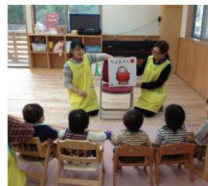
企業内保育園 「大池さんしょう保育園」