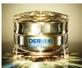
デルメッド プレミアム クリーム No.1